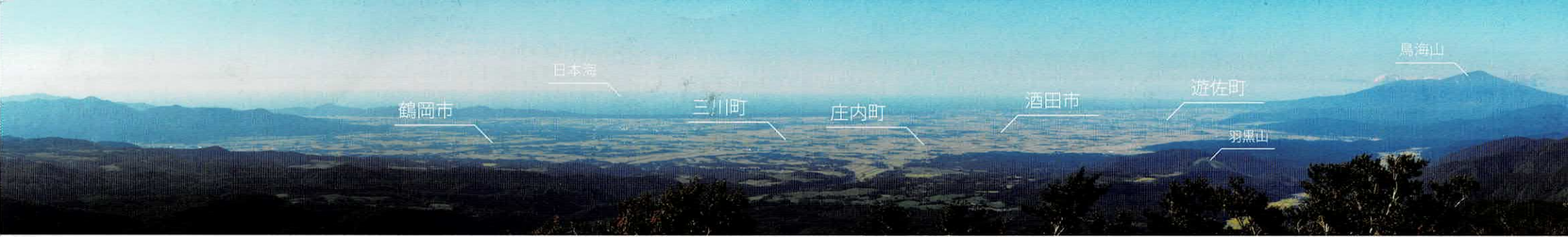
▲月山(1,984m)から見た庄内平野と日本海