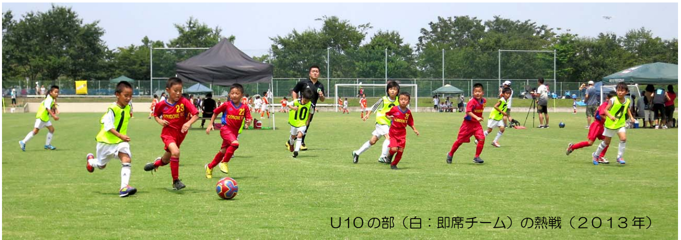
U10の部(白:即席チーム)の熱戦(2013年)

サッカークラブに入っていない子どもはもちろん、サッカーチームの子どもも、チームの活動が休みのときは、個人参加で参加してください。フレッシュな体験ができます。