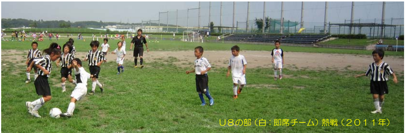
U8の部(白:即席チーム)熱戦(2011年)

サッカークラブに入っていない子どもはもちろん、サッカーチームの子どもも、チームの活動が休みのときは、個人参加で参加してください。フレッシュな体験ができます。