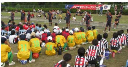
FC東京のサッカークリニック