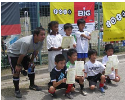
U8の部の即席チーム表彰