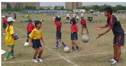
FC東京のサッカークリニック