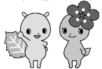
府中市青少年健全育成イメージキャラクター「けやきら&うめちゃん」