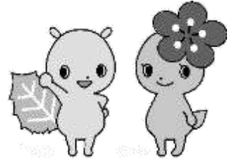
府中市青少年健全育成イメージキャラクター「けやきち&うめちゃん」

令和5年度（5年4月始～6年3月末日迄）の登録受付を 行っています。登録受付はけやきッズ教室で行います。 詳細は電話またはけやきッズ教室でおたずねください ※実施時間「☆印10月は 13:00～17:00 までです」