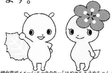
府中市青少年健全育成イメージキャラクター「けやぎら&うめちゃん」

※ 実施時間「☆印8月は 13:00～17:00 までです」 ★印夏休み期間は 9:00～12:00、13:00～17:00 まで