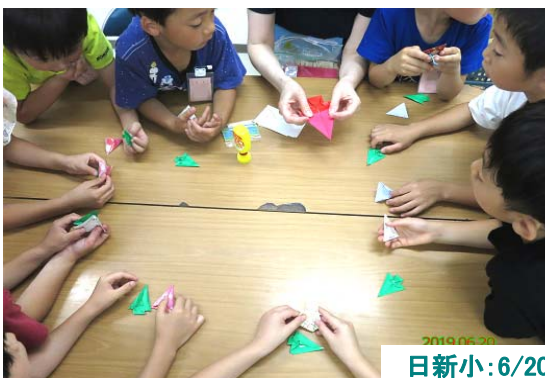
日新小:6/20. おりがみ教室