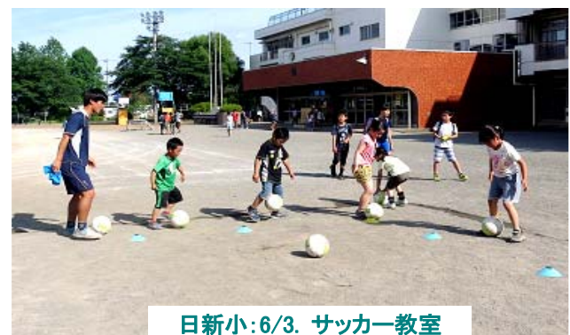
日新小:6/3. サッカー教室