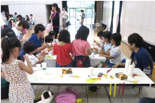
南町小:6/22. けやきっずまつり・科学体験教室 (実行委員会主催)