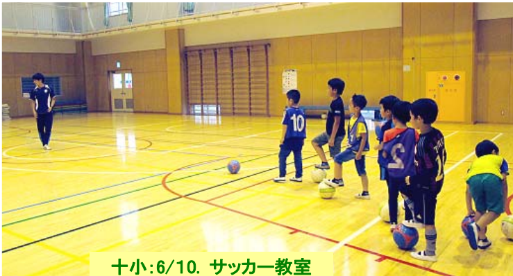
十小:6/10. サッカー教室