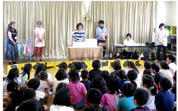
南町小:5/20. ひょうたんのもり第10回 (学童クラブ連携)