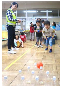
南町小:6/10. ペットボーリング大会