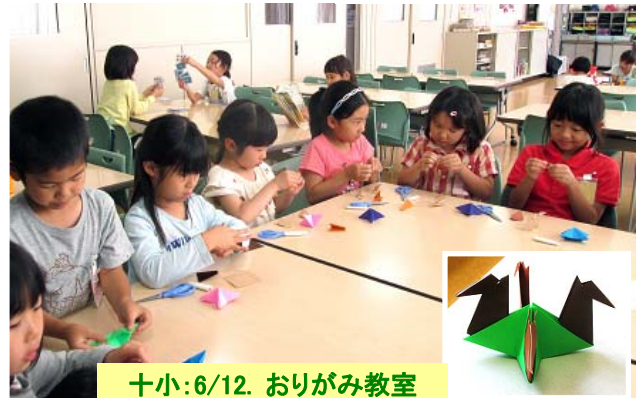
十小:6/12. おりがみ教室