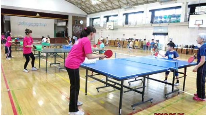
六小:6/26. 卓球教室(実行委員会主催)

このニュースの目的は、府中YSSが受託した4校のスタッフの皆様へ、事業の状況をお伝えすると共に、研修資料として役立たせていただきたいと思います。どうぞ宜しくお願い致します 令和元年6月に行われました各校のイベントの様子です