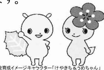
府中市青少年健全育成イメージキャラクター「けやきち&うめちゃん」

令和元年度(～令和2年3月末日迄)の登録受付をしています。 新規及び継続登録受付はけやきッズ教室で行います。 詳細はけやきッズ教室にお問合せ下さい。