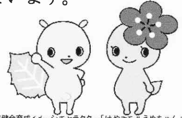
府中市青少年健全育成イメージキャラクター「けやぎら&うめちゃん」

平成31年度(～令和2年3月末日迄)の登録受付をしています。 新規及び継続登録受付はけやきッズ教室で行います。 詳細はけやきッズ教室にお問合せ下さい。