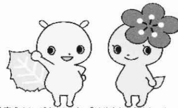
府中市青少年健全育成イメージキャラクター「けやまち&うめちゃん」