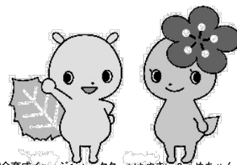
府中市青少年健全育成イメージキャラクター「けやきら&うめちゃん」

※ 実施時間「☆印3月は 13:00～17:00 終了です」 ★印春休みは 9:00～12:00、13:00～17:00 です