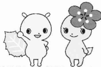
府中市青少年健全育成イメージキャラクター「けやきち&うめちゃん」

※ 実施時間「☆印1月は 13:00～17:00 終了です」 冬休み期間の ★印は 9:00～12:00、13:00～17:00 です