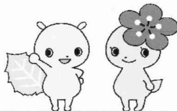
府中市青少年健全育成イメージキャラクター「けやきち&うめちゃん」

※ 実施時間「☆印1月は 13:00～17:00 終了です」 冬休み期間の ★印は 9:00～12:00、13:00～17:00 です