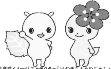
府中市青少年健全育成イメージキャラクター「けやきち&うめちゃん」