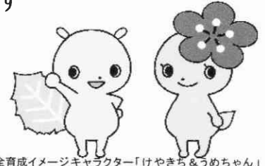
府中市青少年健全育成イメージキャラクター「けやきち&うめちゃん」

※ 終了時間「☆印の7月は17:30終了」です 夏休み期間の ★印は 9:00～12:00、13:00～17:00 です