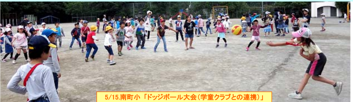
5/15.南町小「ドッジボール大会(学童クラブとの連携)」