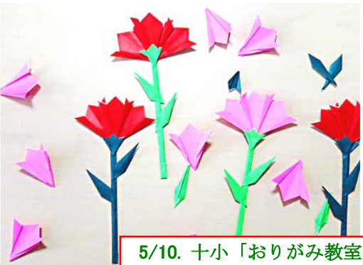
5/10. 十小「おりがみ教室」