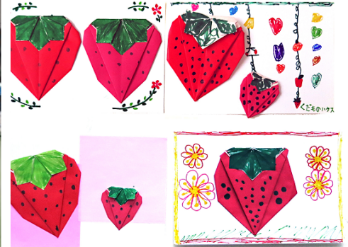
5/9. 六小「おりがみ教室」