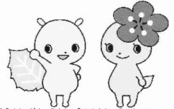
府中市青少年健全育成イメージキャラクター「けやきち&うめちゃん」

29年度(～30年3月末日迄)の登録受付をしています 登録受付は随時けやきッズ教室で行なっています。 詳細は日新小けやきッズにお問合せ下さい。